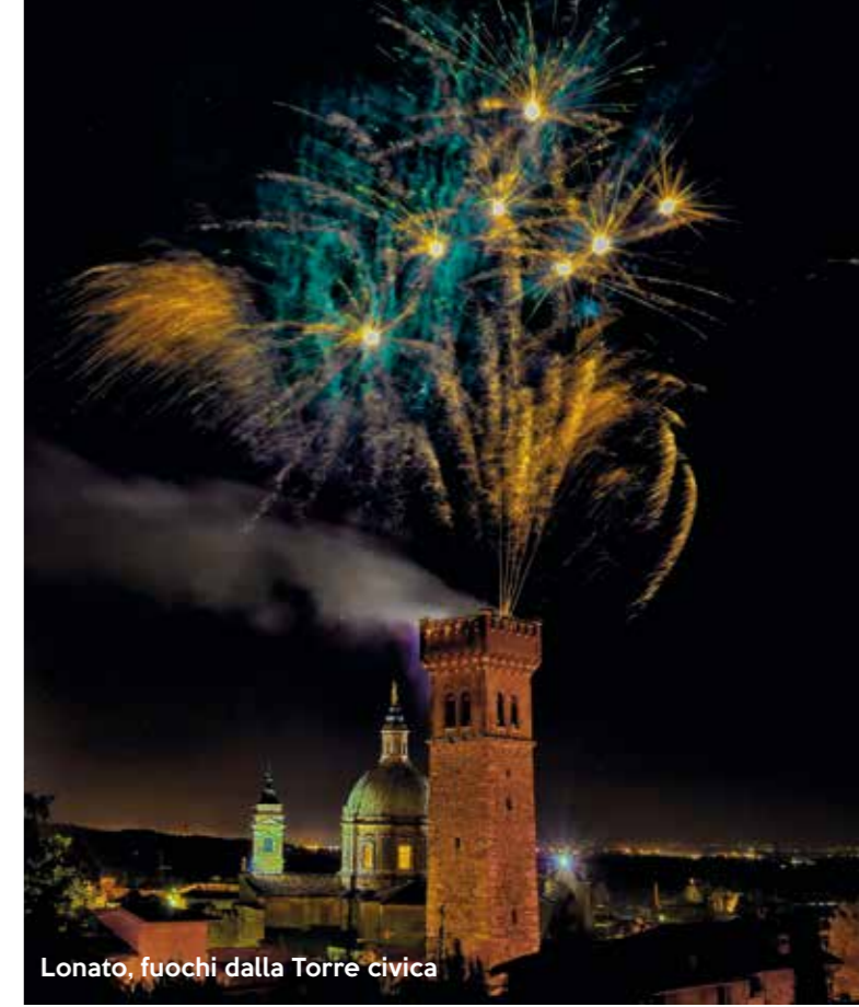
Lonato, fuochi dalla Torre civica

Qui durante l'anno si tengono manifestazioni che richiamano turisti da tutta Italia e dall'estero, come "Fiori nella Rocca" in primavera ( www.fiorinellarocca.it ) e "Lonato in Festival" ad agosto ( www.lonatoinfestival.it ). Nella Rocca ha inoltre sede il Museo civico ornitologico con 700 esemplari di uccelli impagliati. Nel centro storico di Lonato, fra le varie testimonianze del passato, meritano una visita anche la torre civica, la basilica di San Giovanni Battista in stile barocco e il palazzo Municipale con la Sala del Consiglio che espone un'antica mappa settecentesca del territorio e una grande tela del pittore veneziano Andrea Celesti (1637-1712). Nella piazza del Comune, ogni terza domenica del mese, si tiene il mercatino dell'antiquariato. Da questa cittadina gioiello si raggiungono in pochi minuti Padenghe, Moniga e Manerba , con i loro suggestivi castelli medievali e i ricchi ritrovamenti di epoca romana.